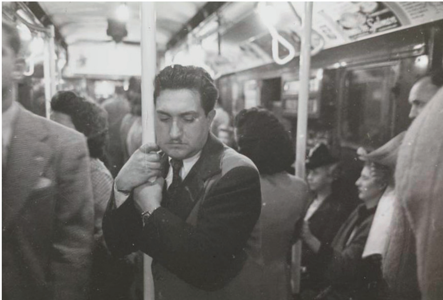
kuva: Stanley Kubrick