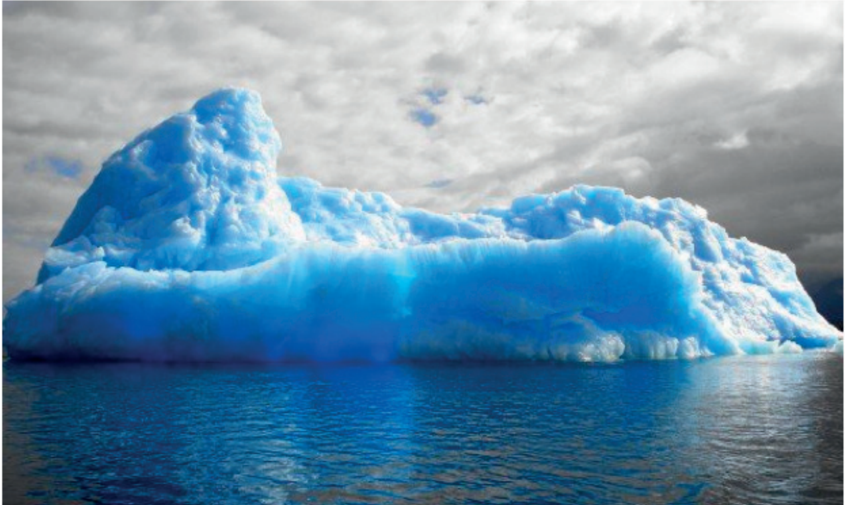
An image of an iceberg off the coast of Chile by Sarah Scurr, taken in 2006. Scurr was accused of plagiarism by Chilean photographer Marisol Ortiz Elfeltdt, who was on the same cruise.