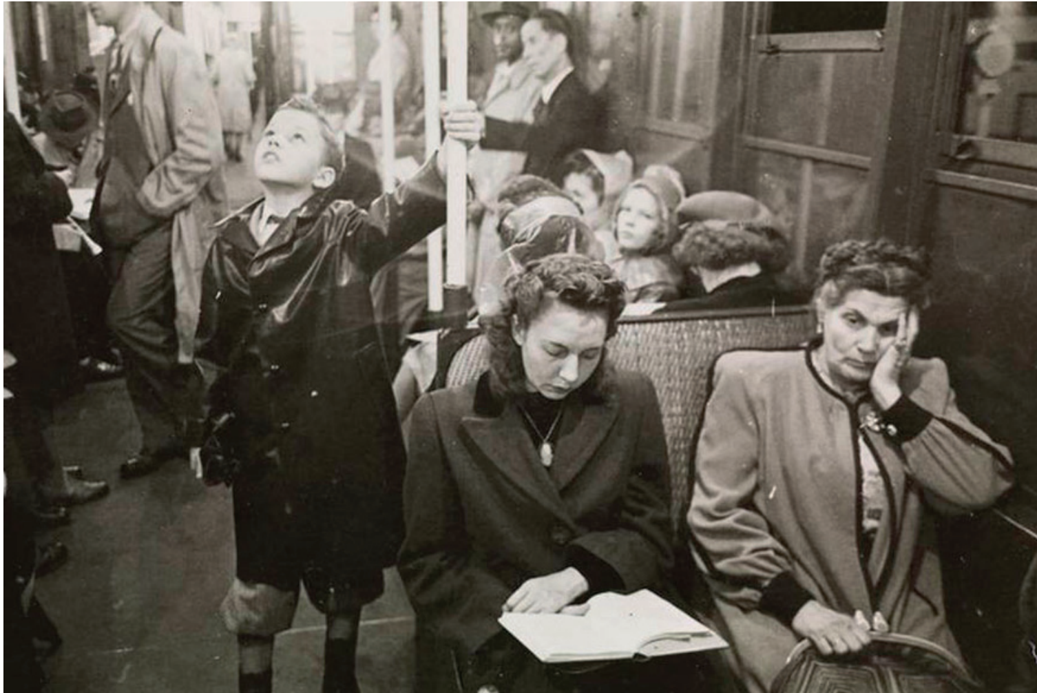
kuva: Stanley Kubrick New york

Mitä tunnetila oik. naisella kertoo, entä pojan?